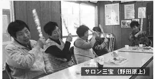
サロン三宝（野田原上）

サロンでの健康チェックや防犯・防災への心がけなど、ひとりで悩むよりたくさんの人と情報を共有することで心配ごとの解消につながります。