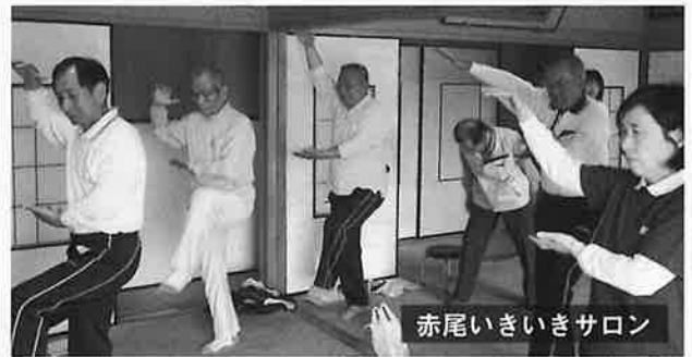
赤尾いきいきサロン

いろいろな人が出会い、交流することで仲間ができ、豊かな人間関係をつくることができます。サロンが自然と閉じこもり予防、孤独感の解消につながります。