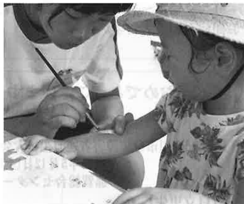
昨年のイベントボランティア （フェイスペイント）