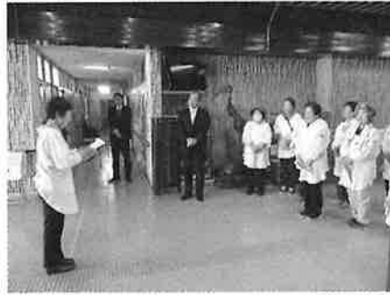
クリーンキャンペーンの様子