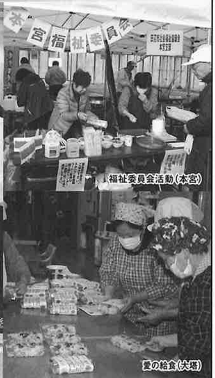
福祉委員会活動(本宮)