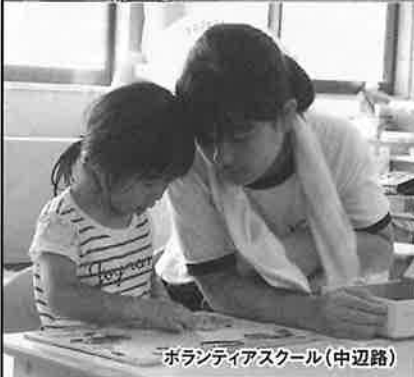
ボランティアスクール(中辺路)