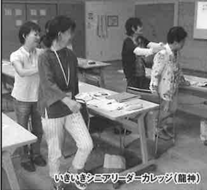
いきいきシニアリーダーカレッジ(龍神)