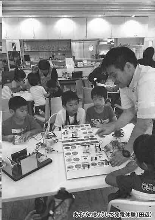
おそびのきょうしつ発電体験(田辺)