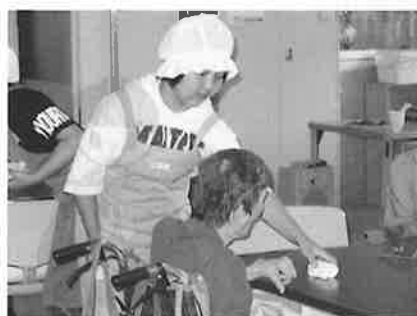
デイサービス体験