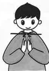
「神」を拝むように、手のひらを2回程合わせます。