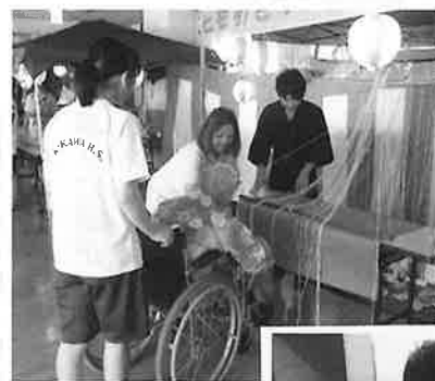
福祉施設での体験

◎たった2日間でしたが、職員のみなさんは丁寧に優しく説明してくれ、利用者のみなさんは温かく受け入れてくれたので、とても感動しました。特に利用者の方から「来てくれてありがとう」と言われたときは、とてもうれしかったし、ここに来てよかったと思いました。