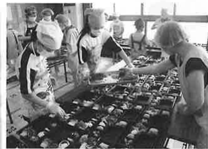
食事サービス体験