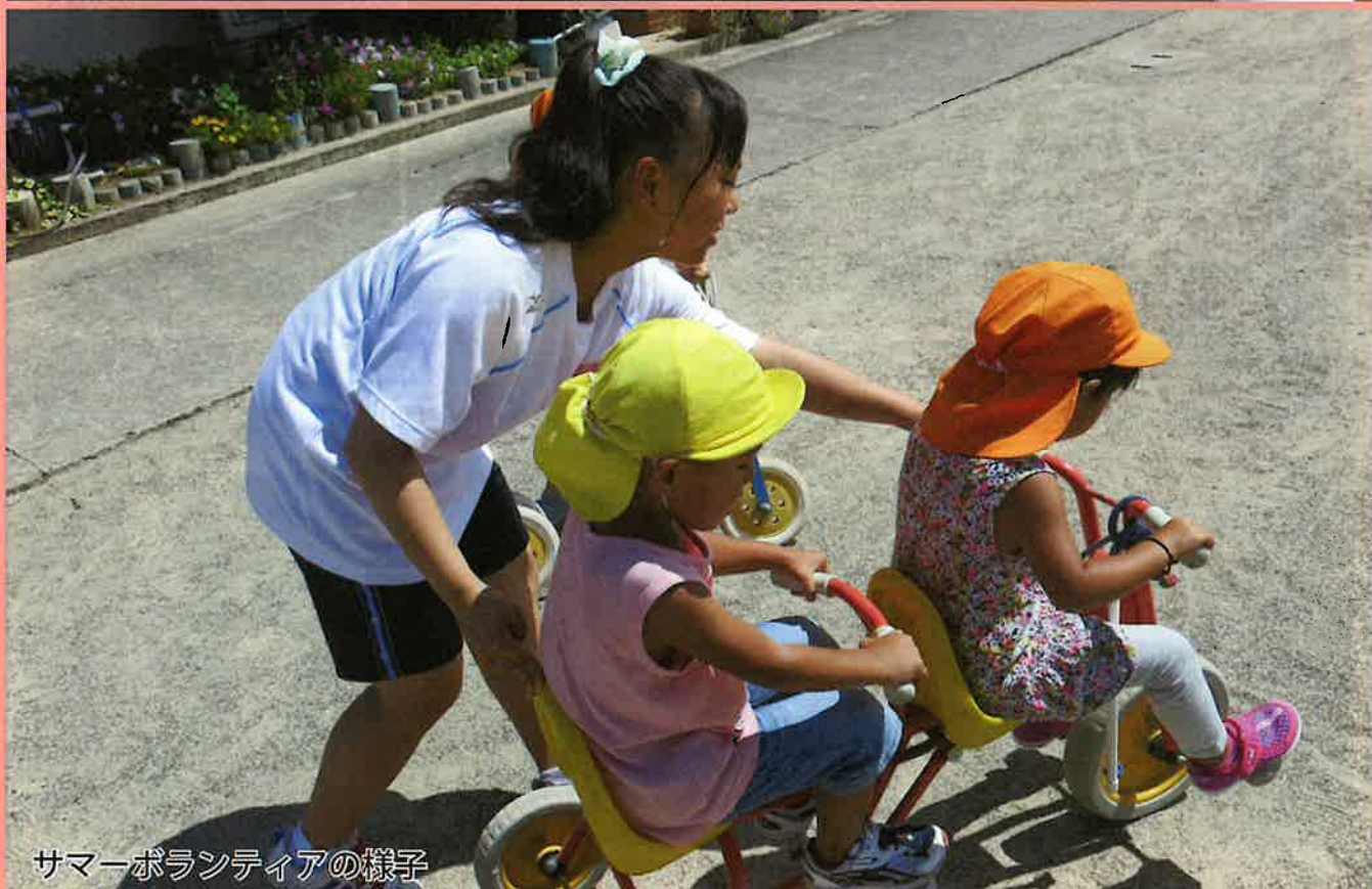
サマーボランティアの様子