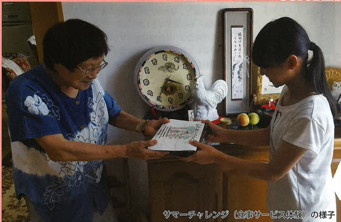
サマーチャレンジ（食事サービス体験）の様子