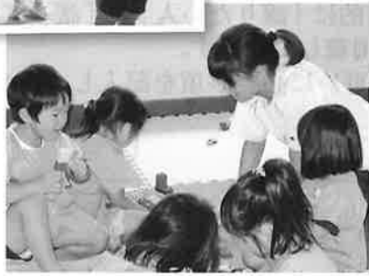
保育所（園）での体験

◎たった2日間でしたが、職員のみなさんは丁寧に優しく説明してくれ、利用者のみなさんは温かく受け入れてくれたので、とても感動しました。特に利用者の方から「来てくれてありがとう」と言われたときは、とてもうれしかったし、ここに来てよかったと思いました。