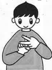
左手の人差し指と中指を出し、右手の人差し指真ん中にあてます。（千を表します）