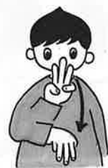
「川」という漢字の表現です。