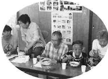
手作りカレーの試食

この日のメニューはカレー、切干大根サラダ、蒸しケーキでした。どれも非常食とは思えない味で参加者からは「美味しい！」と声があり、とても良い機会となりました。