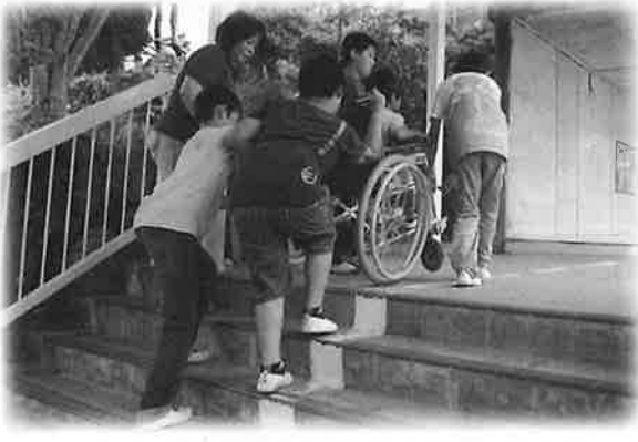
車イス体験の様子

4年生は総合的な学習の時間に「福祉」について学んでいます。「車イスに乗っている人の怖さが分かって大変だと思いました。これからは、車イスに乗っているお年寄りや体が不自由な人が困っていたら、出来る事は手伝い助けようと思いました。心のバリアフリーは大切だと思いました。」（児童の感想文より）