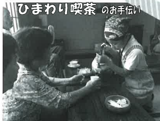
ひまわり喫茶 のお手伝い