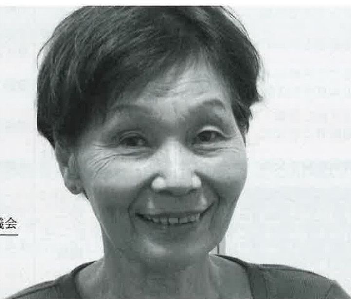
町ボランティア連絡協議会

私のボランティア活動のきっかけは、子どもが幼稚園の時に同じ保護者の悩みや意見を聞くことからはじまりました。当時は、私もボランティアとは思わなかったのですが、それが『傾聴』のはじまりと気づき、「場所を提供して、その人の心に寄り添うことは、立派なボランティアよ。」と言っていただき、うれしく思いました。これなら私でも続けてできると思ったのが、はじまりだったと思います。その後、幼稚園・小学校などのPTA役員として活動後、地元とのさまざまな活動を通じて、たくさんの人との出会いがあり、知り合えたことが、自分自身の成長につながったのだと思います。また、ボランティアメンバーからの支えもあり、仲間がいたからこそ大変なことも乗り越えられ、楽しさに変えることができました。それと、忘れてはいけないのは、