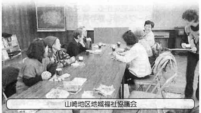
山崎地区地域福祉協議会