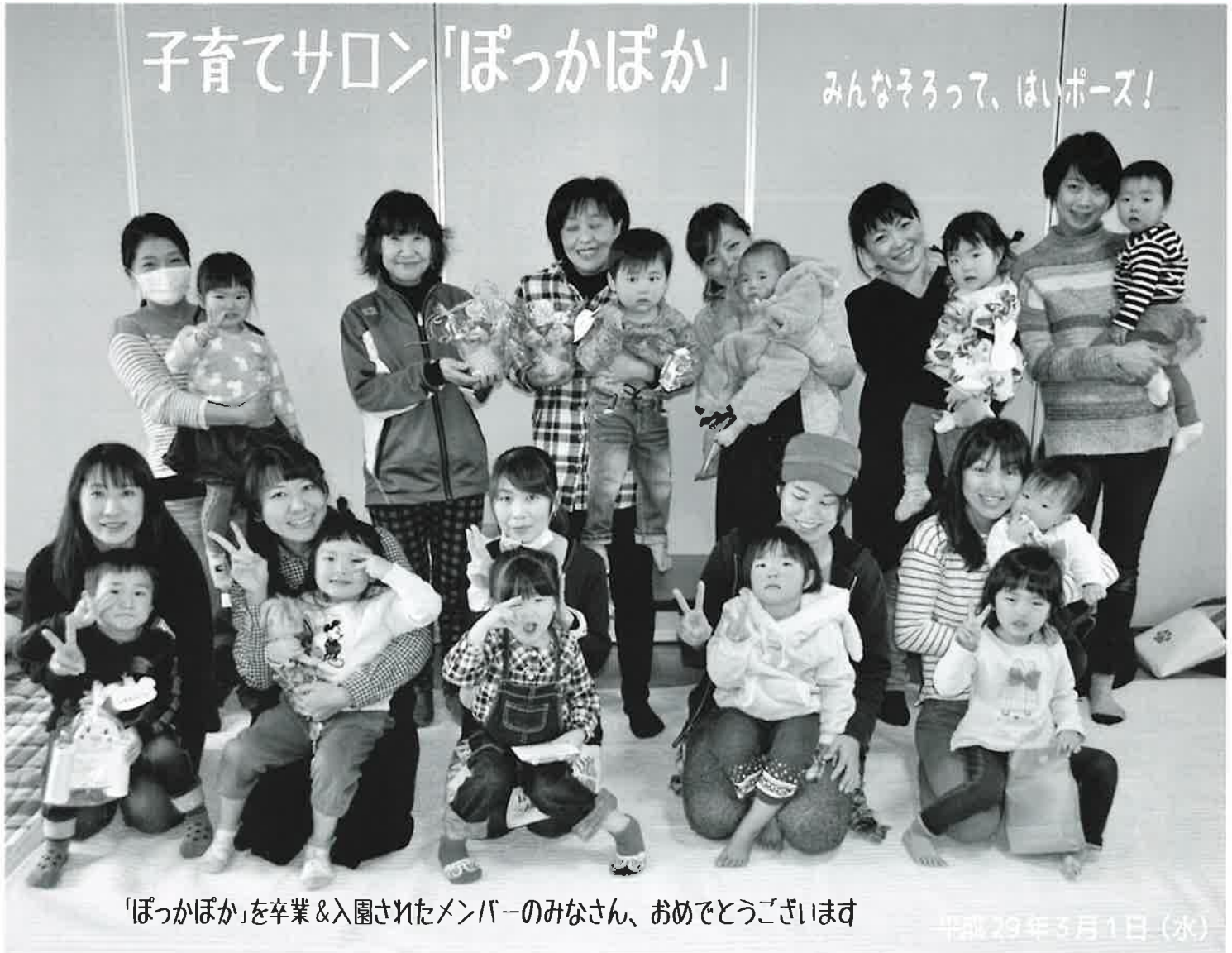
「ぽっかぽか」を卒業&入園されたメンバーのみなさん、おめでとうございます

学校法人きたば学園 和歌山社会福祉専門学校 TEL0737-67-2270 FAX 0737-67-2095 http://www.wakayama-syakaifukushi.ac.jp/