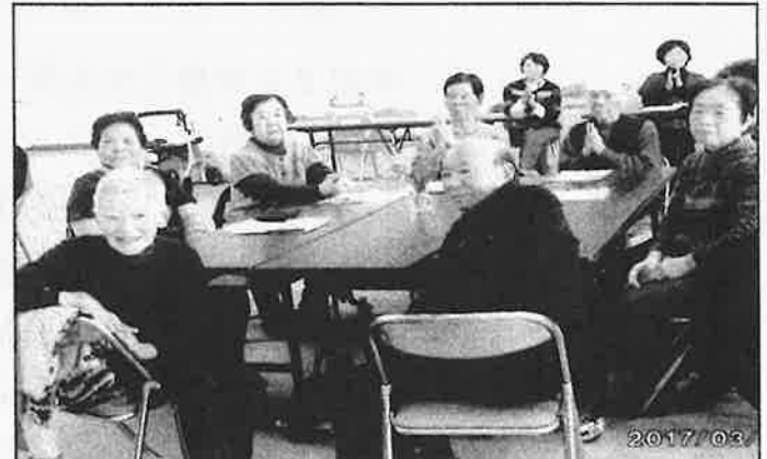
【向島保育所の子どもたちが楽しい劇や歌などを元気よく披露してくれました。】

平成28年度の「ほのぼの茶話ごう会」は、町内在住の一人暮らし高齢者の方々を対象に年4回開催し、合計218名の方々が参加されました。