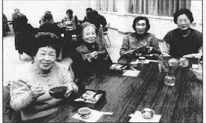
【ボランティア推進協議会女性役員の方々による手作り弁当を皆さんでおいしく頂きました。】