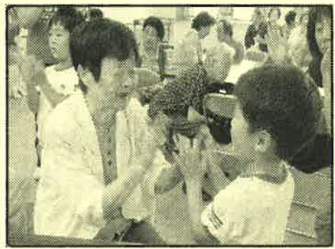
【 昨 年 度 の 様 子 】