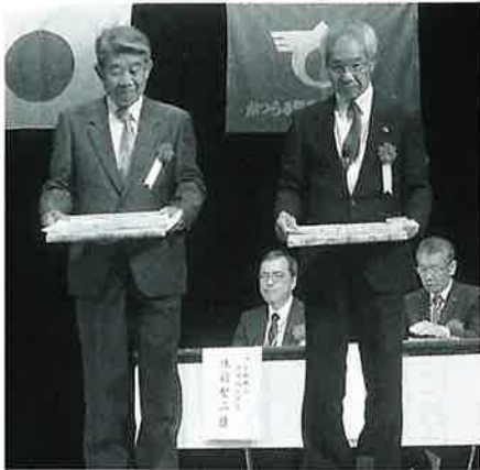
志賀鶴寿会 (天野支部) 新田ちとせ会 (妙寺支部)