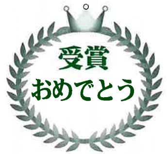
◇かつらぎ町長表彰 優良老人クラブ