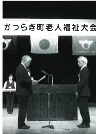
かつらぎ町老人福祉大会