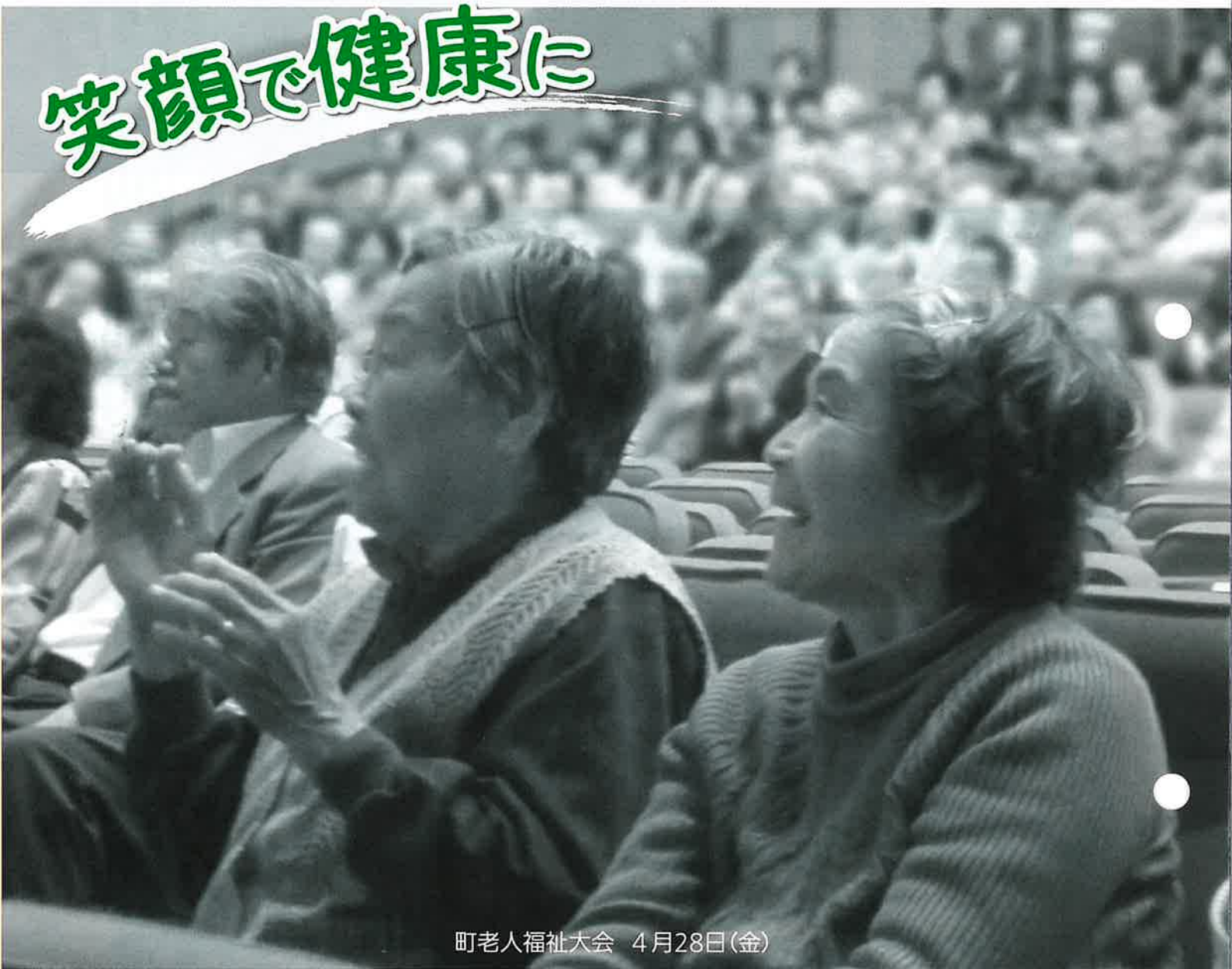
町老人福祉大会 4月28日(金)