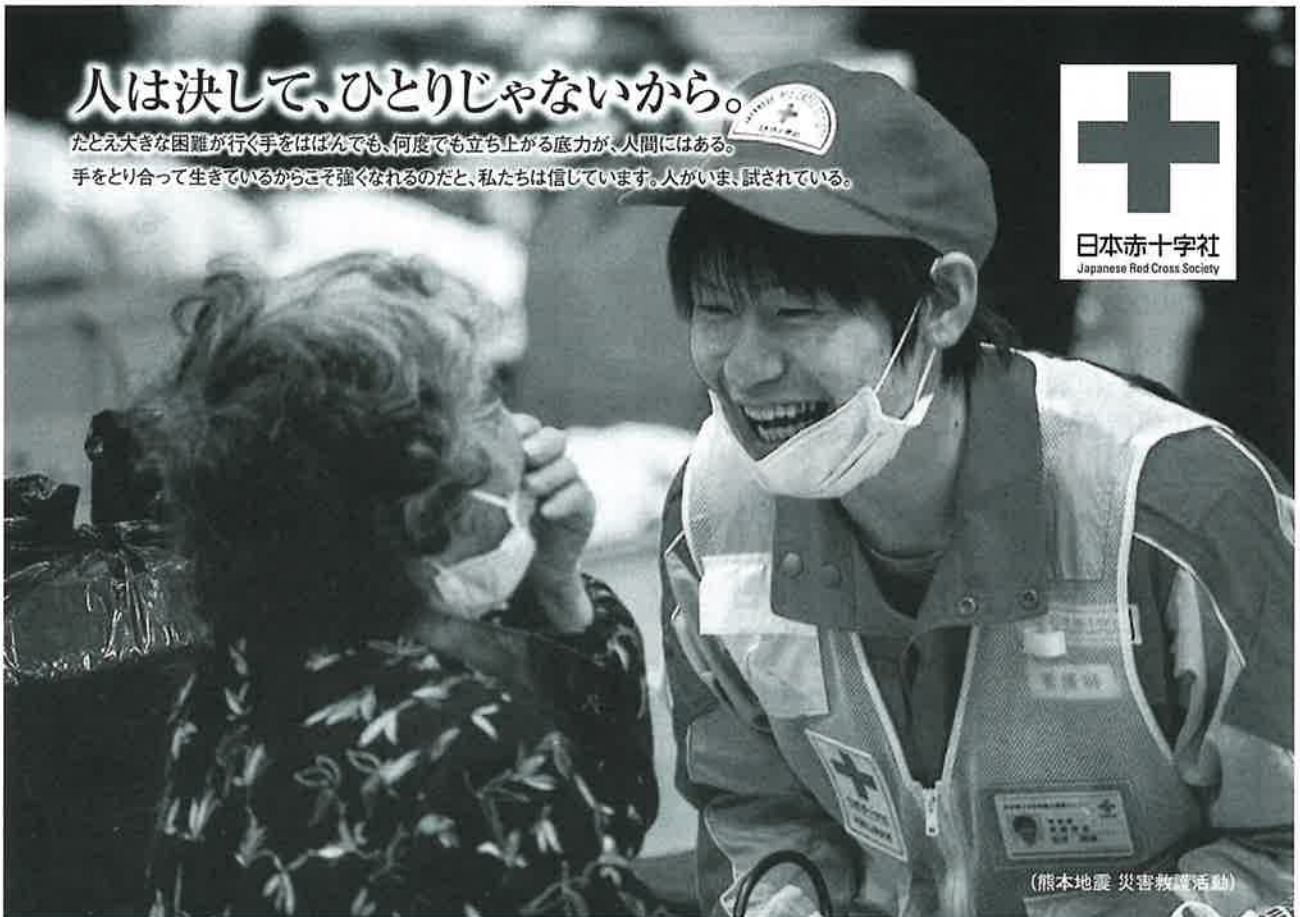
(熊本地震 災害救護活動)

日本赤十字社の人道的支援活動は、皆様からのご寄付で支えられています。 活動資金へのご支援を、よろしくお願いいたします。